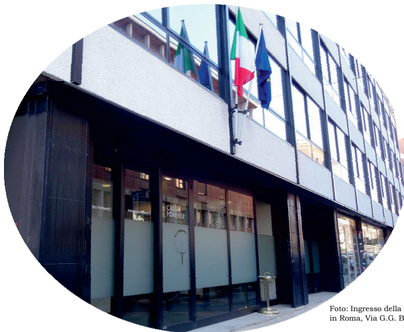
Foto: Ingresso della Cassa Forense in Roma, Via G.G. Belli, 5